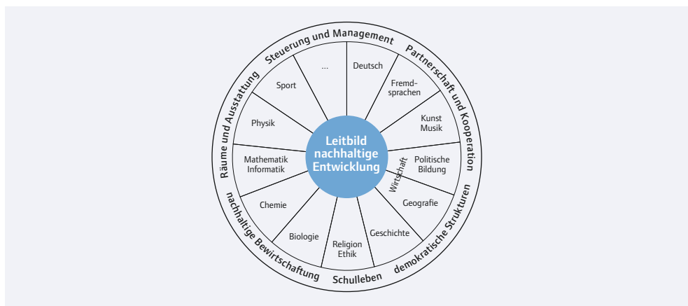
Abb. 4: Whole School Approach – Einbettung des Leitbilds nachhaltige Entwicklung in die formale Bildung

Schulen können als Mikrokosmos der Gesellschaft verstanden werden. Sie stehen wie viele andere Institutionen vor Herausforderungen eines nachhaltigen facility management, eines verantwortungsbewussten Gebrauchs von Ressourcen, der Gestaltung demokratischer Partizipation, der Inklusion und Bearbeitung sozio-kultureller Konflikte. Dies können sie mit ihrem Bildungsauftrag verbinden. Sie werden damit zum Vorbild und zum Lernfeld fürs Leben.