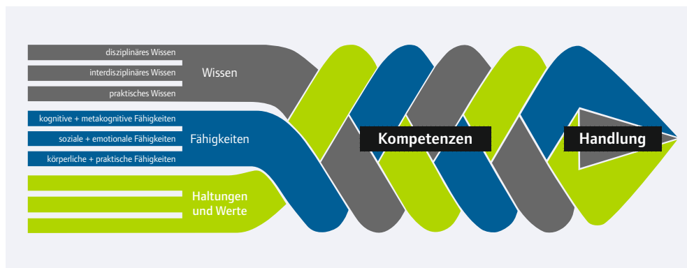
Abb. 2: Kompetenzmodell

keiten, Motivation, Bereitschaft sowie die richtige Einstellung benötigt werden, um ein Problem zu lösen. Einfach gesagt geht es um Dispositionen, um so bestimmten Erfordernissen zu genügen. BNE-Kompetenzen können bei der Lösung gegenwärtiger und zukünftiger Herausforderungen in variablen Situationen helfen.