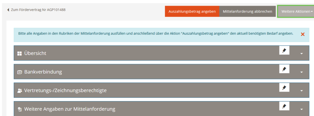
Abbildung 6 Auswahl "Auszahlungsbedarf eingeben".