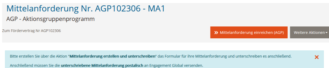
Abbildung 8 Mittelanforderung einreichen.

Bitte achten Sie darauf, das erstellte PDF auszudrucken und von einer zeichnungsberechtigten Person unterschrieben per Post einzureichen.